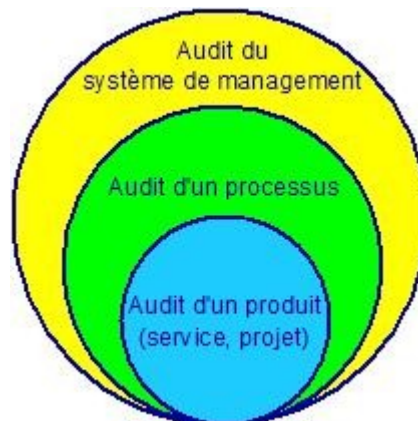
Figure 1-1. types d'audits internes

Processus : activités qui transforment des éléments d'entrée en éléments de sortie