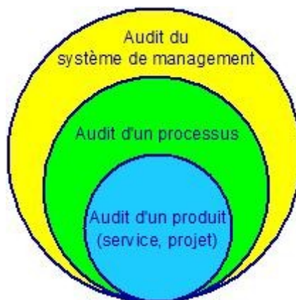
Figure 1-1. Types d'audits internes

Processus : activités qui transforment des éléments d'entrée en éléments de sortie